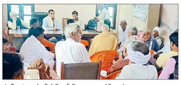
पूंडरी। गांव मुनोहरी में बिजली निगम द्वारा आयोजित ओपन दरबार का दृश्य।

तुरंत कड़ी कार्रवाई एसपी ने कहा कि अपराधिक इतिहास वाले व्यक्तियों पर निगरानी मजबूत करने के लिए पुलिस ने 36 बदमाश व कुचरिय व्यक्तियों की हिस्ट्रीशीट खोली है, हिस्ट्रीशीट खोलने से उस व्यक्ति पुलिस द्वारा निगरानी की जाती है। भविष्य के किसी भी अपराध पर तुरंत कड़ी कार्रवाई की जाती है। इसके अलावा 6 आरोपियों की बैल कैसिल करने की प्रक्रिया न्यायालय में विचारधीन है। अपराध से अंतित रापित पर कर्वाई करते हुए एक आरोपी को 3 मरला प्रॉर्टेंट अटेंच करवाई गई है, जबकि बार अन्य आरोपियों की रापितियों की अटेंचमेंट प्रक्रिया अदालत में जारी है।