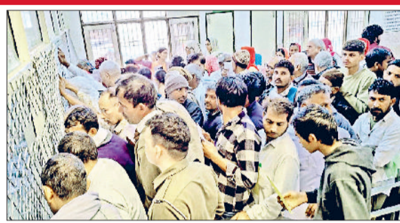
जींद। दवा खिड़की पर परेशान लोग।