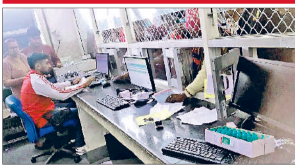
जींद। दवा खिड़की पर अकेले दवा देते फार्मासिस्ट।