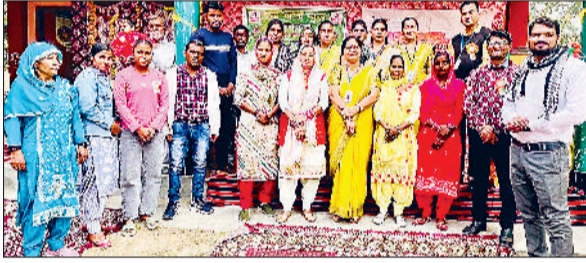
कैथल। कार्यक्रम में भाग लेते हुए विद्यार्थी।